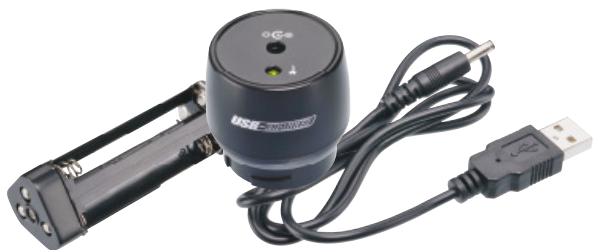
USB CHARGER KIT